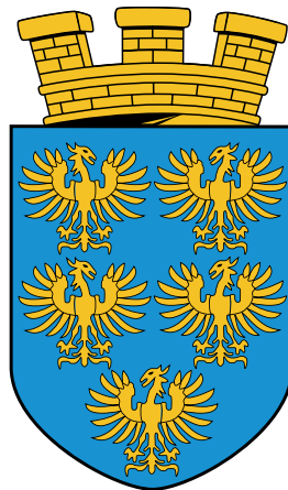
Singkreis St. Lorenzen Niederösterreich