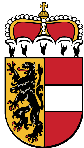
MGV Bürmoos bei Oberndorf Salzburg

SA 11.04.2015 / 19.00 UHR STADTHALLE TERNITZ